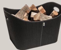
Aduro Baseline brændekurv i PET, sort